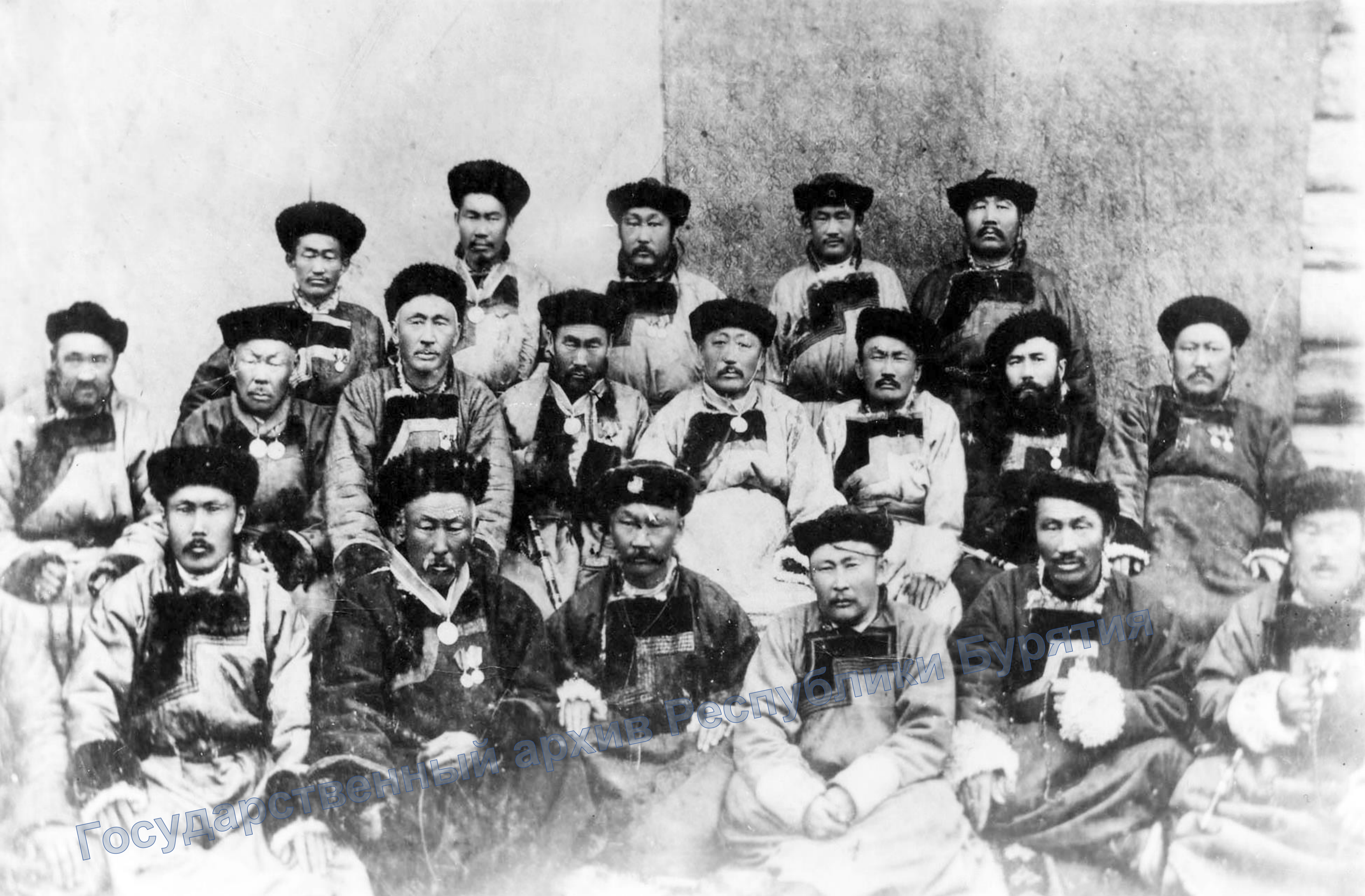
Должностные лица Хоринской Степной думы. Конец XIX в.