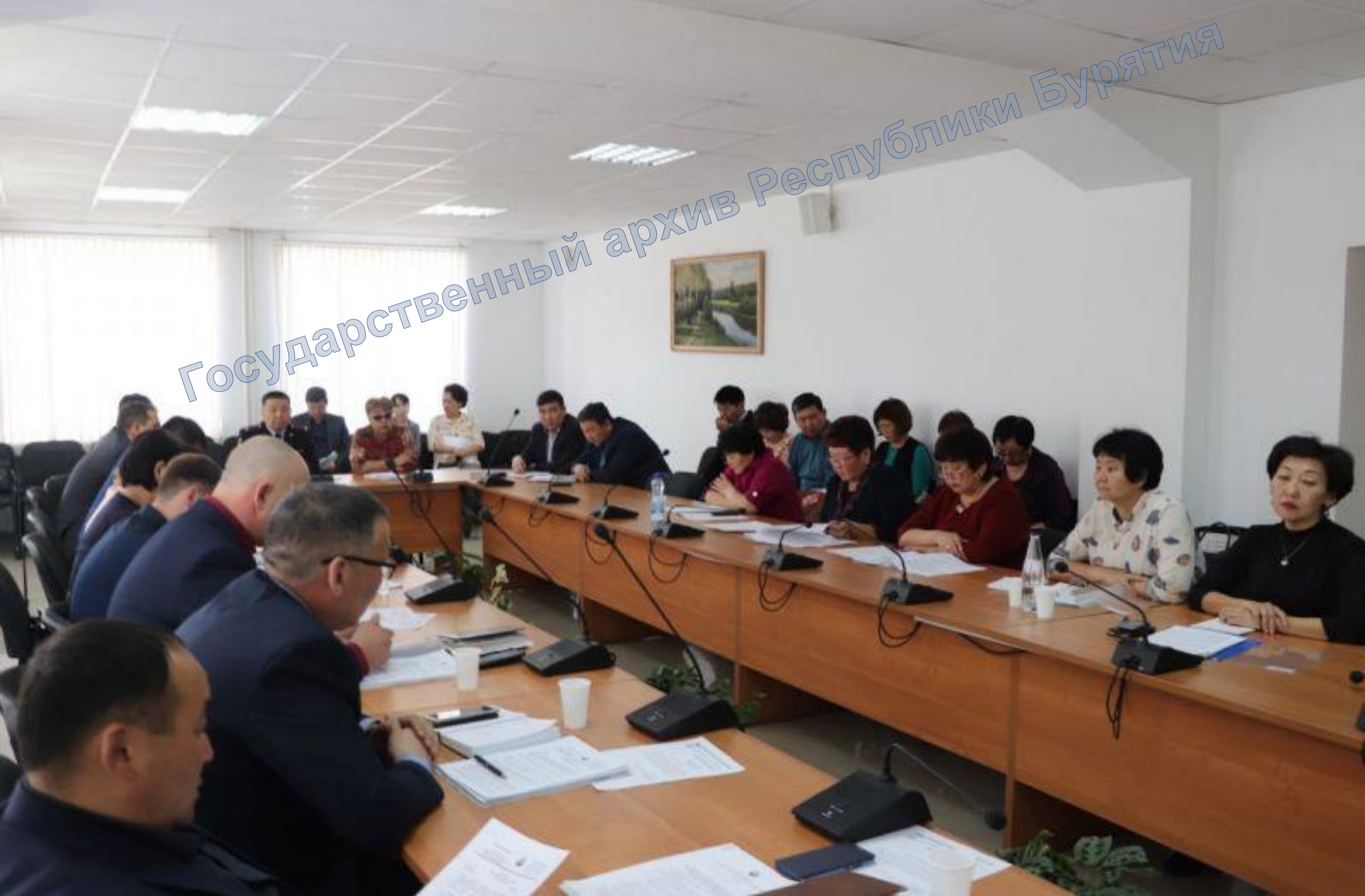
Сессия районного Совета депутатов МО «Закаменский район». 10 апреля 2019 г. Фото с сайта http://mcuzakamna.ru/zakamenskij-rajon/fotogalereya/1801-sessiya-rajonnogo-soveta-deputatov

Государственный архив Республики Бурятия