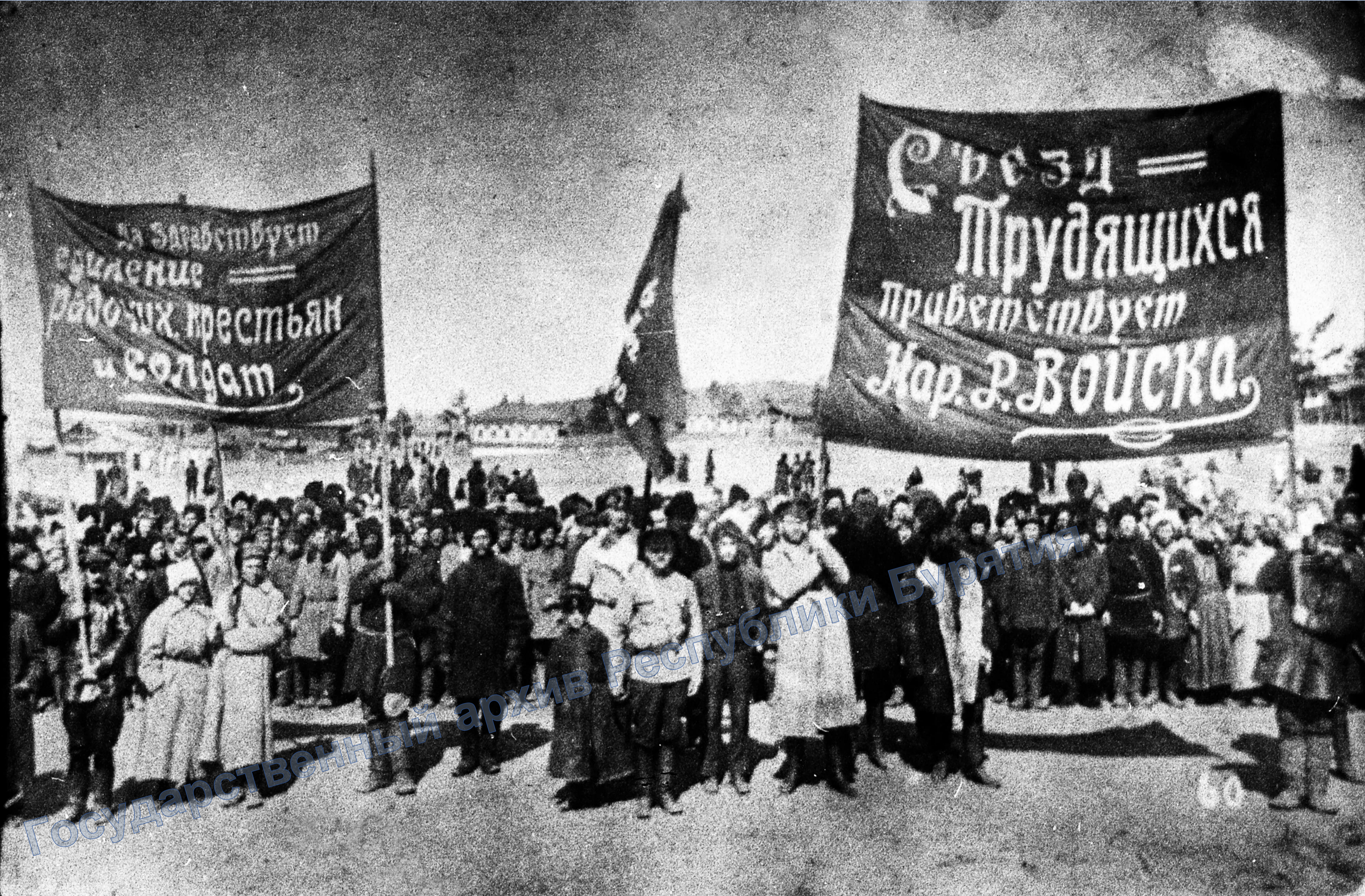
Съезд трудящихся в Прибайкалье в г. Верхнеудинске. Март-апрель 1920 г.