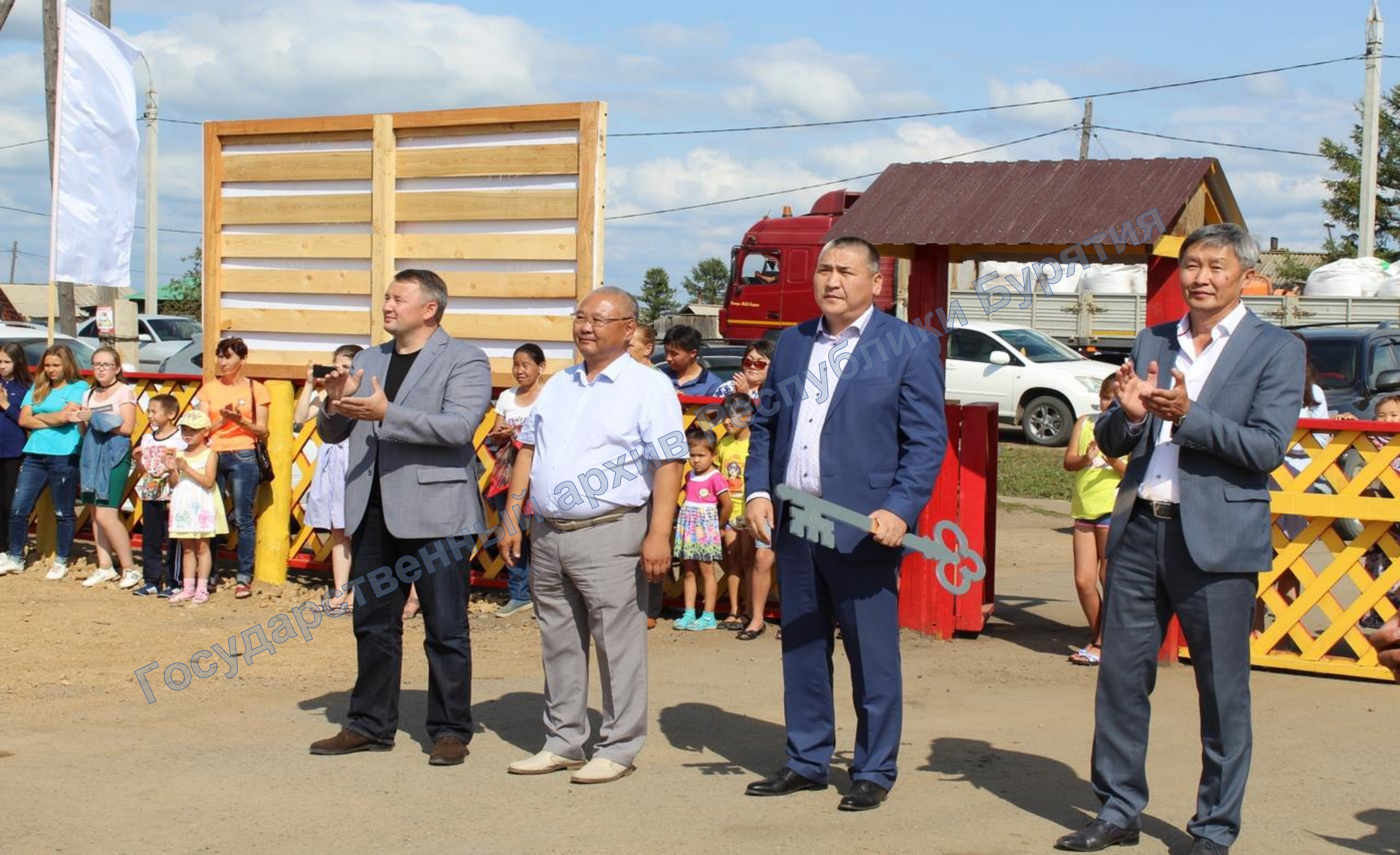
Открытие боксерской юрты «Тамир» в с. Телемба. Стоят слева направо: министр спорта и молодежной политики РБ В.А. Дамдинцурунов, депутат Народного Хурала РБ А.Д. Цыбиков, предприниматель Ч.В. Бальжинимаев, глава МО «Еравнинский район» Ц.Г. Шагдаров. 25 августа 2018 г.