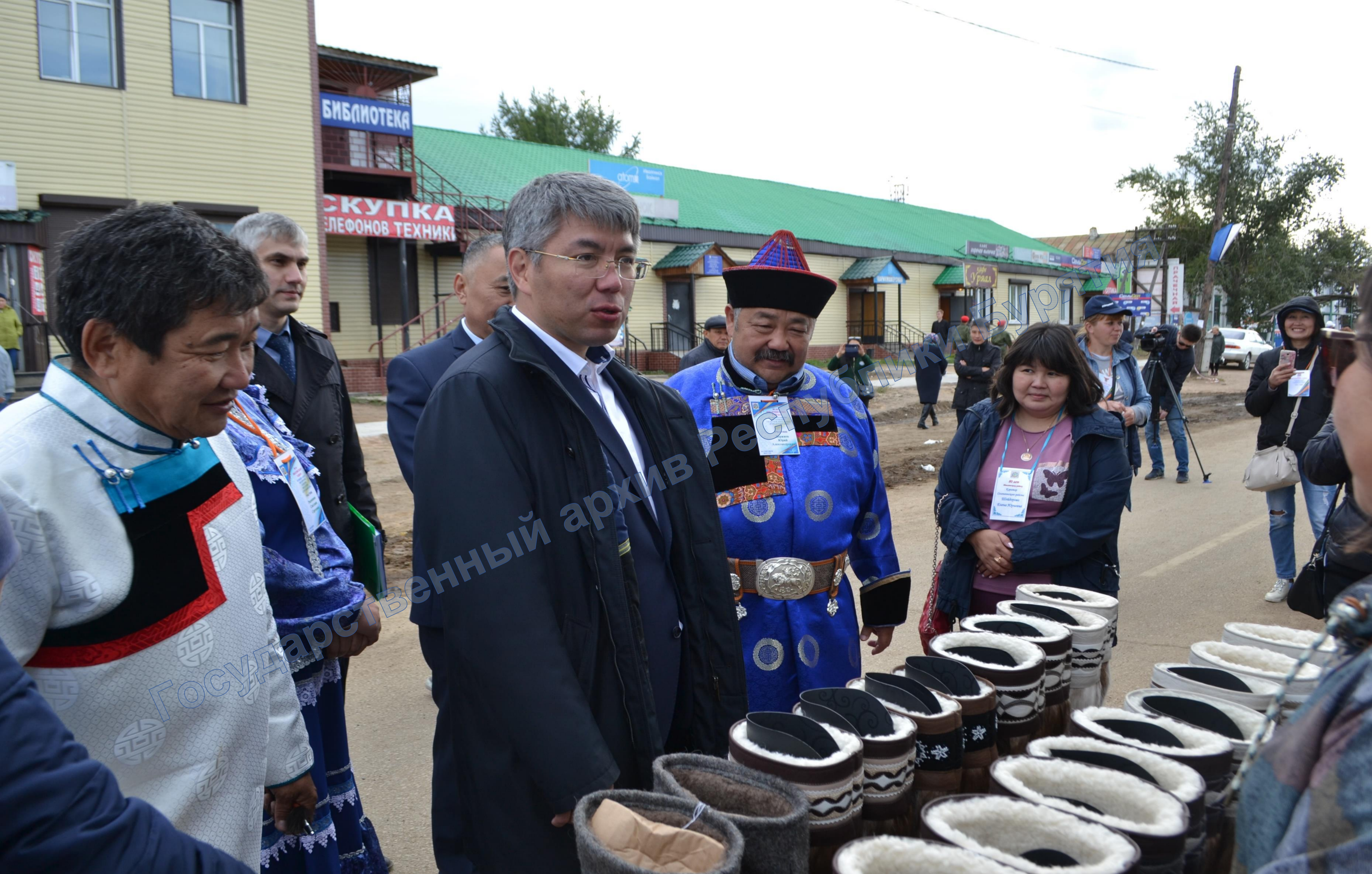
Праздник, посвященном 80-летию со Дня образования Иволгинского района. Слева направо: глава МО «Иволгинский район» В.Ц. Очиров, Глава РБ А.С. Цыденов, глава МО СП «Гурульбинское» Ю.А. Доржиев. 14 сентября 2019 г.