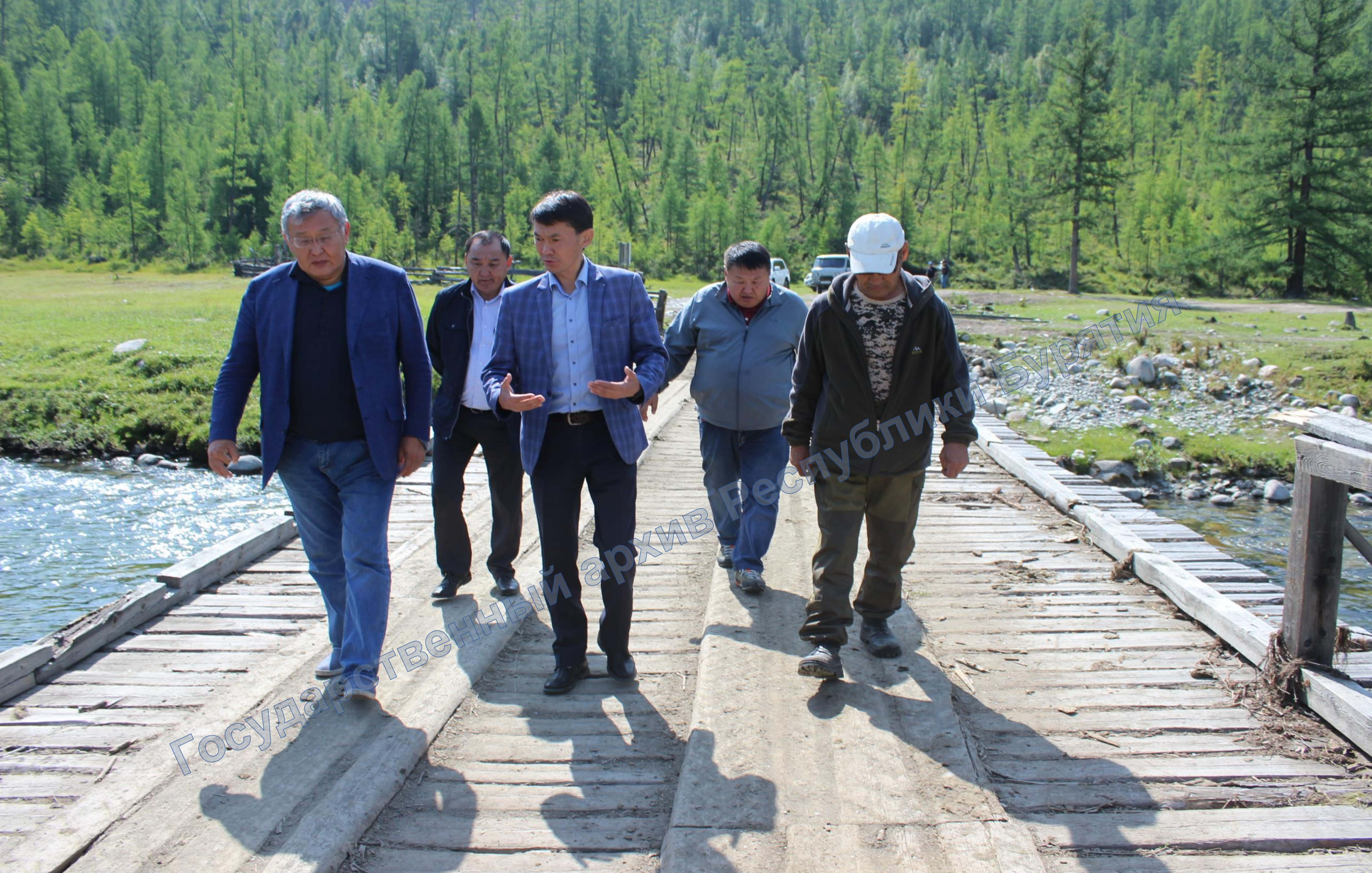
Рабочая поездка в Окинский район. Слева направо: заместитель председателя Правительства РБ Б.Д. Цыренов, глава МО «Окинский район» М.В. Мадасов. 20 августа 2019 г.