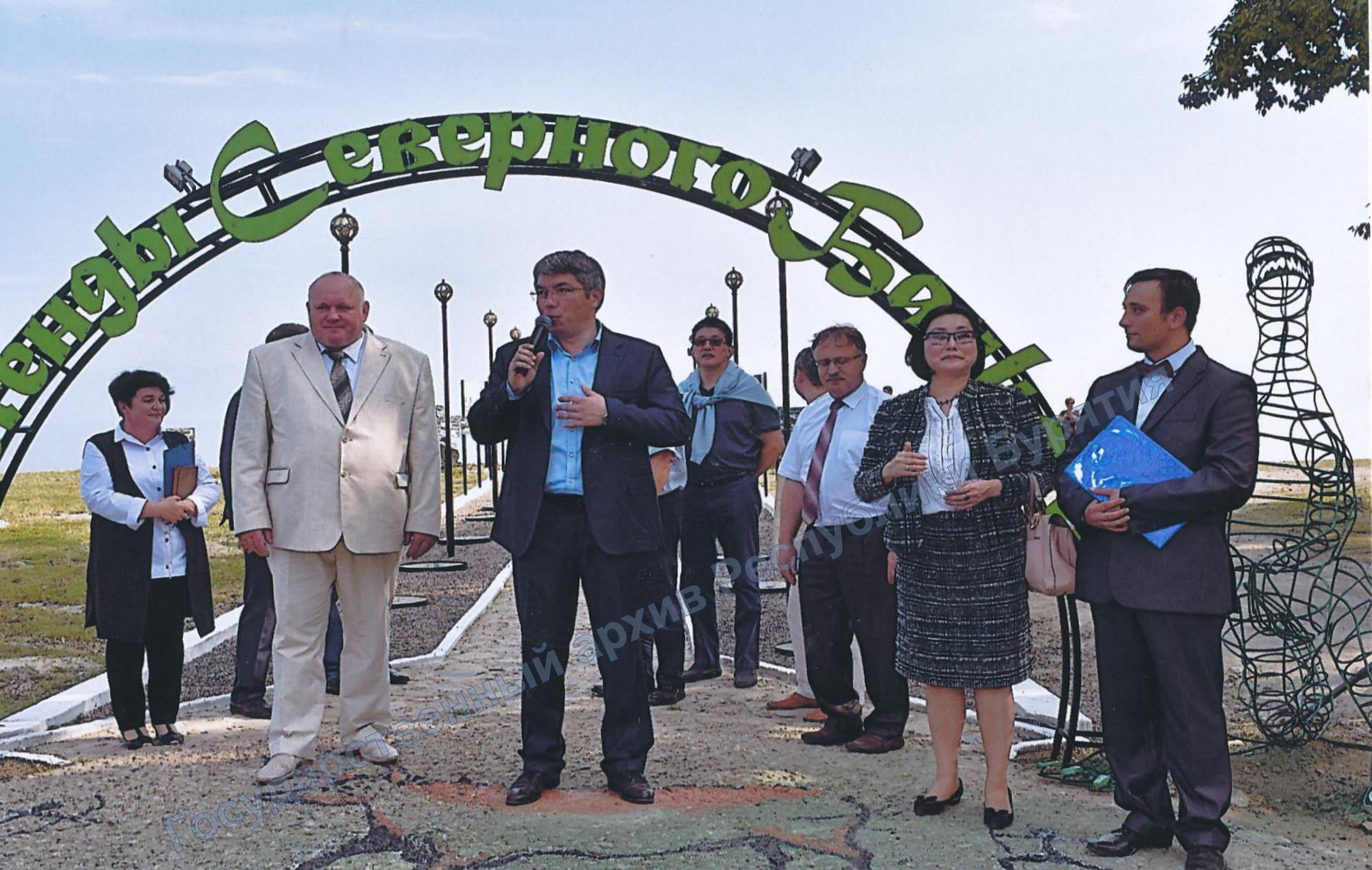
Открытие аллеи «Легенды Северного Байкала». В центре Глава РБ А.С. Цыденов, слева глава МО «Северо-Байкальский район» И.В. Пухарев. 23 августа 2018 г.