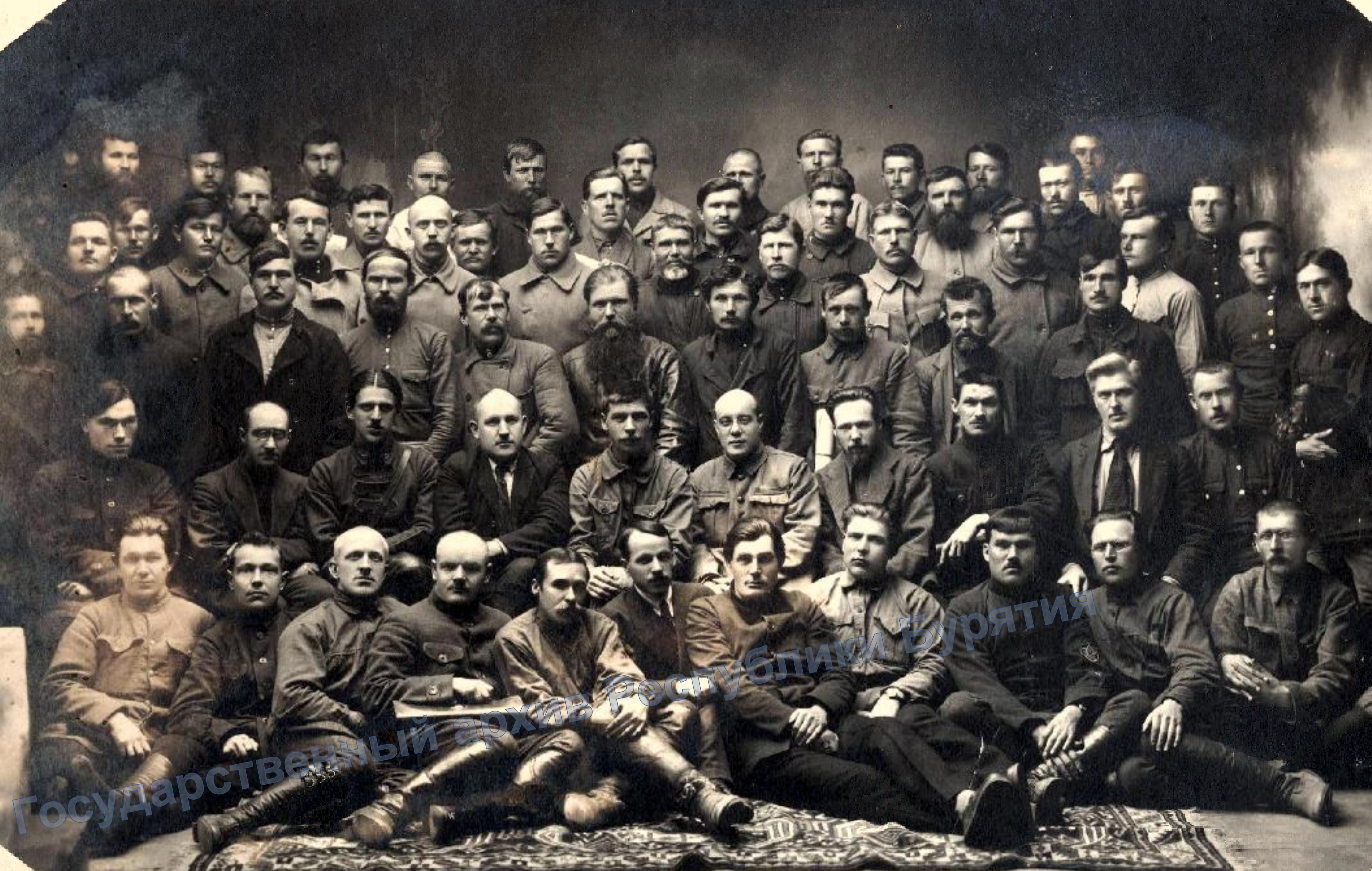
І съезд всех волостных председателей Прибайкальской губернии и заведующих отделов Управления уездных исполнительных комитетов и начальников. Май 1923 г.