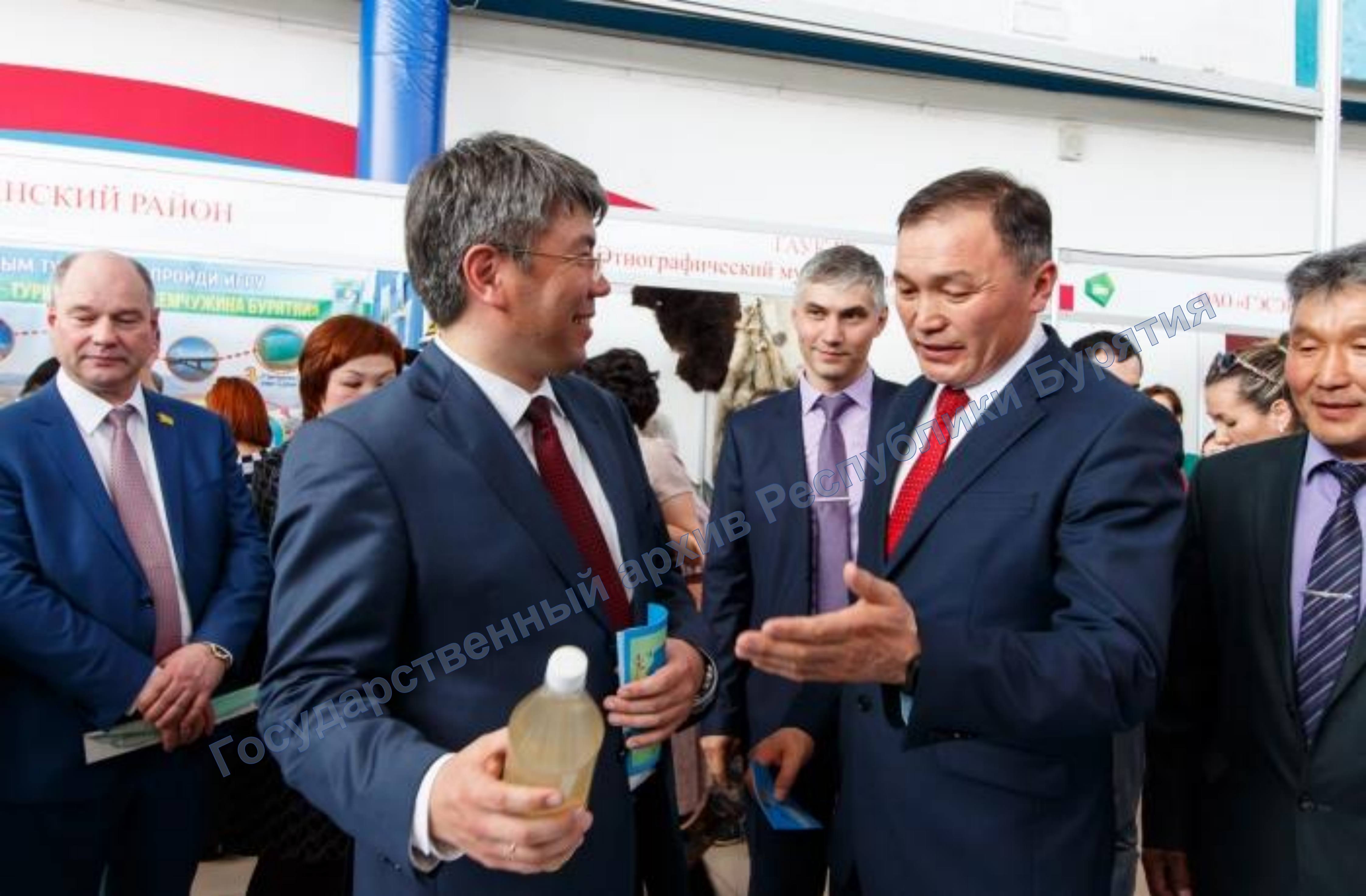
В центре Глава РБ А.С. Цыденов и глава МО «Тункинский район» И.А. Альхеев. 12 июня 2020 г.